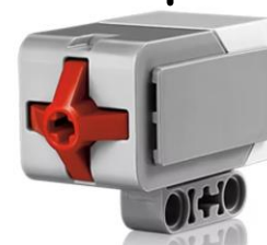
Порт 1 Кнопка «Пуск»