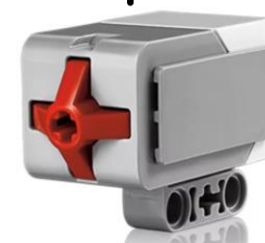
Порт 2 Кнопка «Стоп»