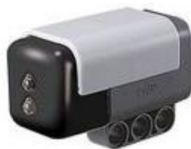
Порт 2 HiTechnic NXT Color Sensor V2