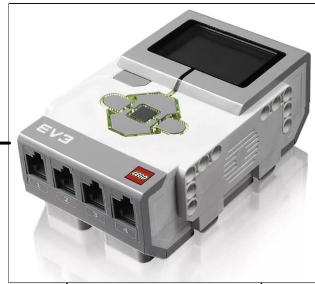
Блок №2 EV3